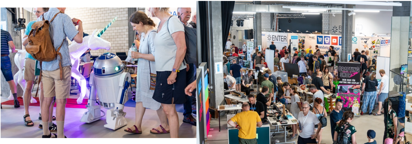
Bilder: Die Maker Faire Solothurn 2025 brachte das DIY- und Innovationsfestival erfolgreich zurück in die Schweiz.- Enter Technikwelt / Oleg Jordi