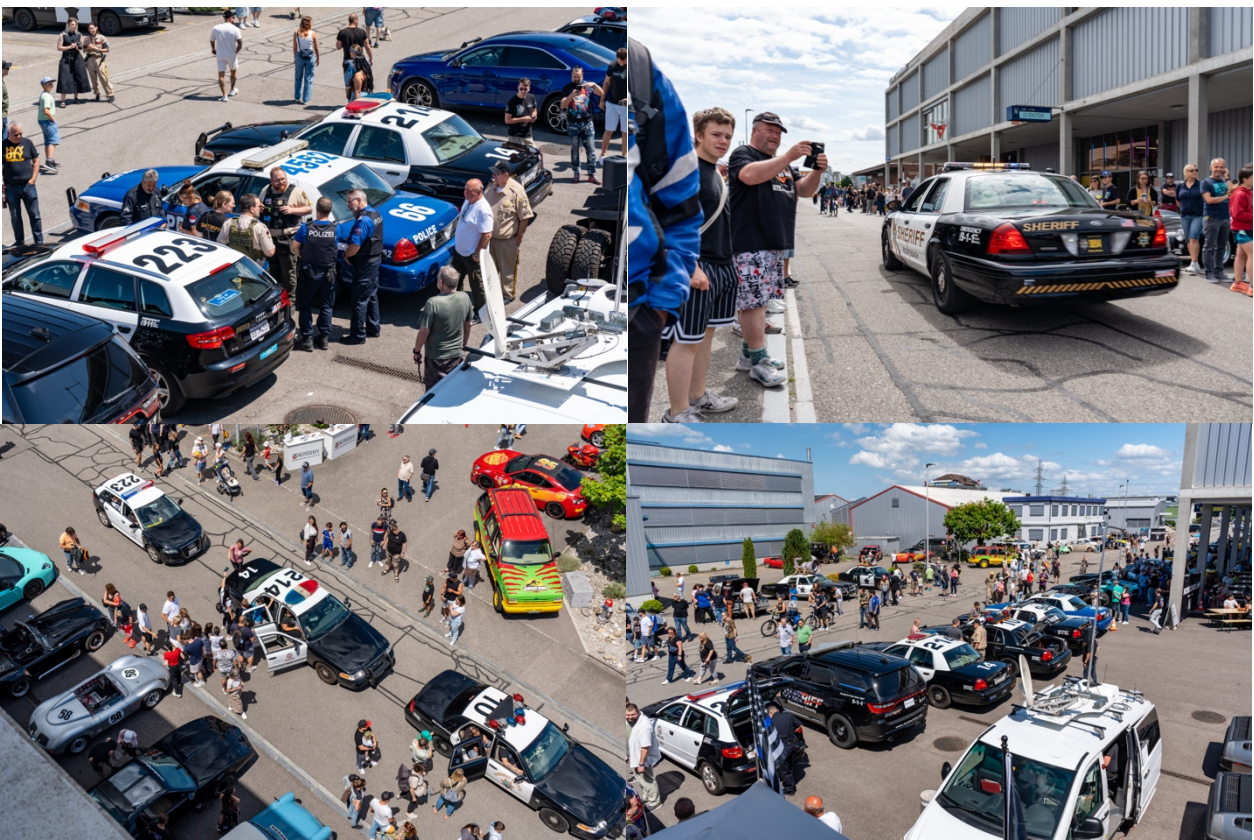
Alte amerikanische Polizei- und Sheriff-Autos auf Rundfahrten mit Besuchern.