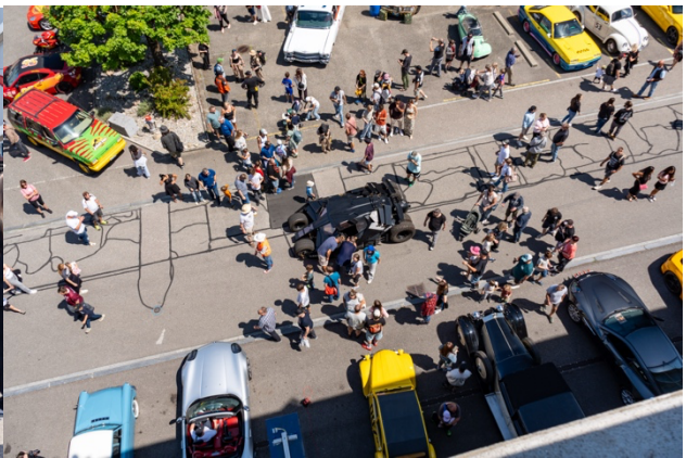
Das Batmobil zog zahlreiche staunende Blicke auf sich.

Hochauflösendes Bildmaterial: https://www.swisstransfer.com/d/62115315-f364-4694-ad79-58b36852141d