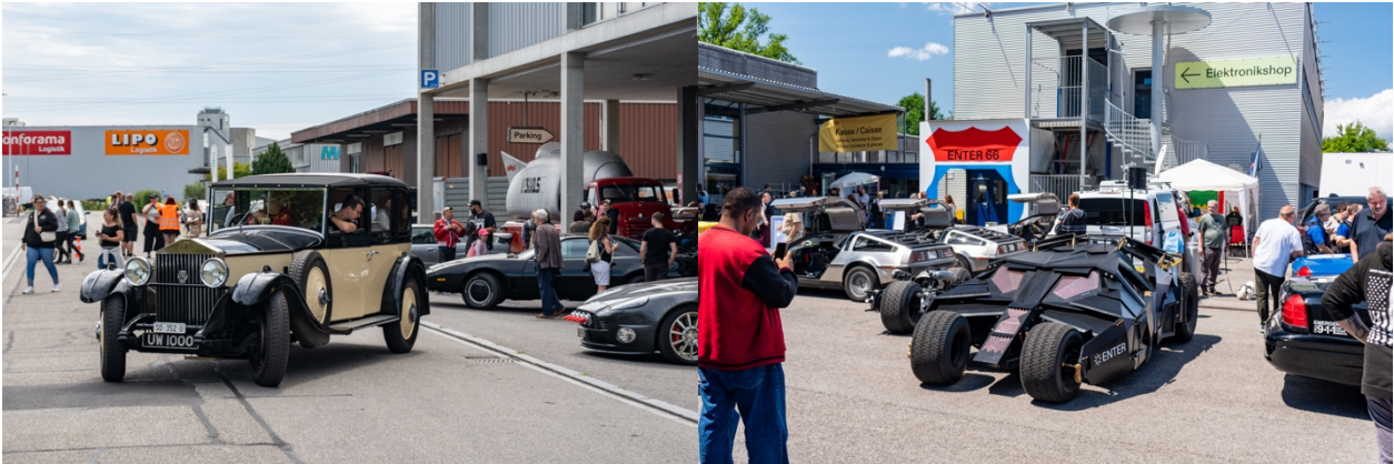
Links: Rolls Royce Phantom von ca. 1930. Rechts: Batmobil «the Tumbler».