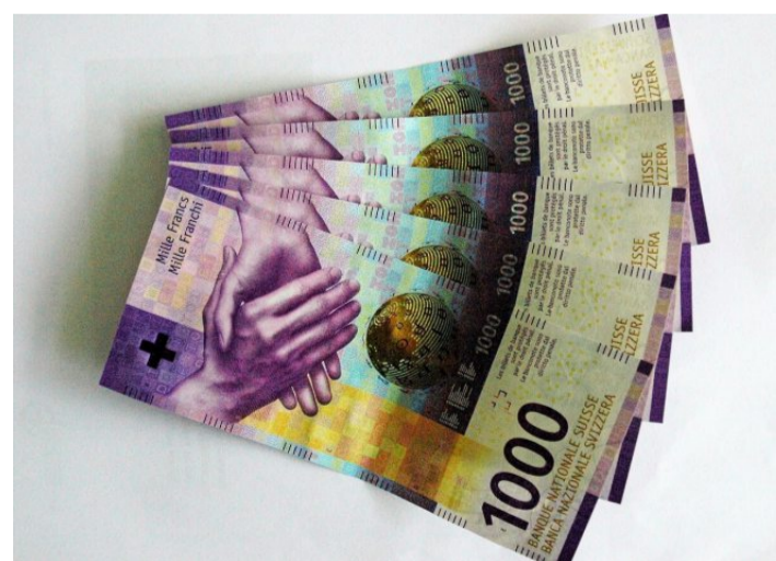
Knapp eine Million Franken Verwaltungskosten stehen im Zusammenhang mit der Alimentenhilfe am 8. März zur Debatte.

Auch die Gegner argumentieren zweigleisig, mit den Finanzen und fehlenden Mitspracherechten. Finanziell sprechen sie von einem Etikettenschwindel des Kantons. Statt um eine Einsparung, wie sie der Massnahmen-