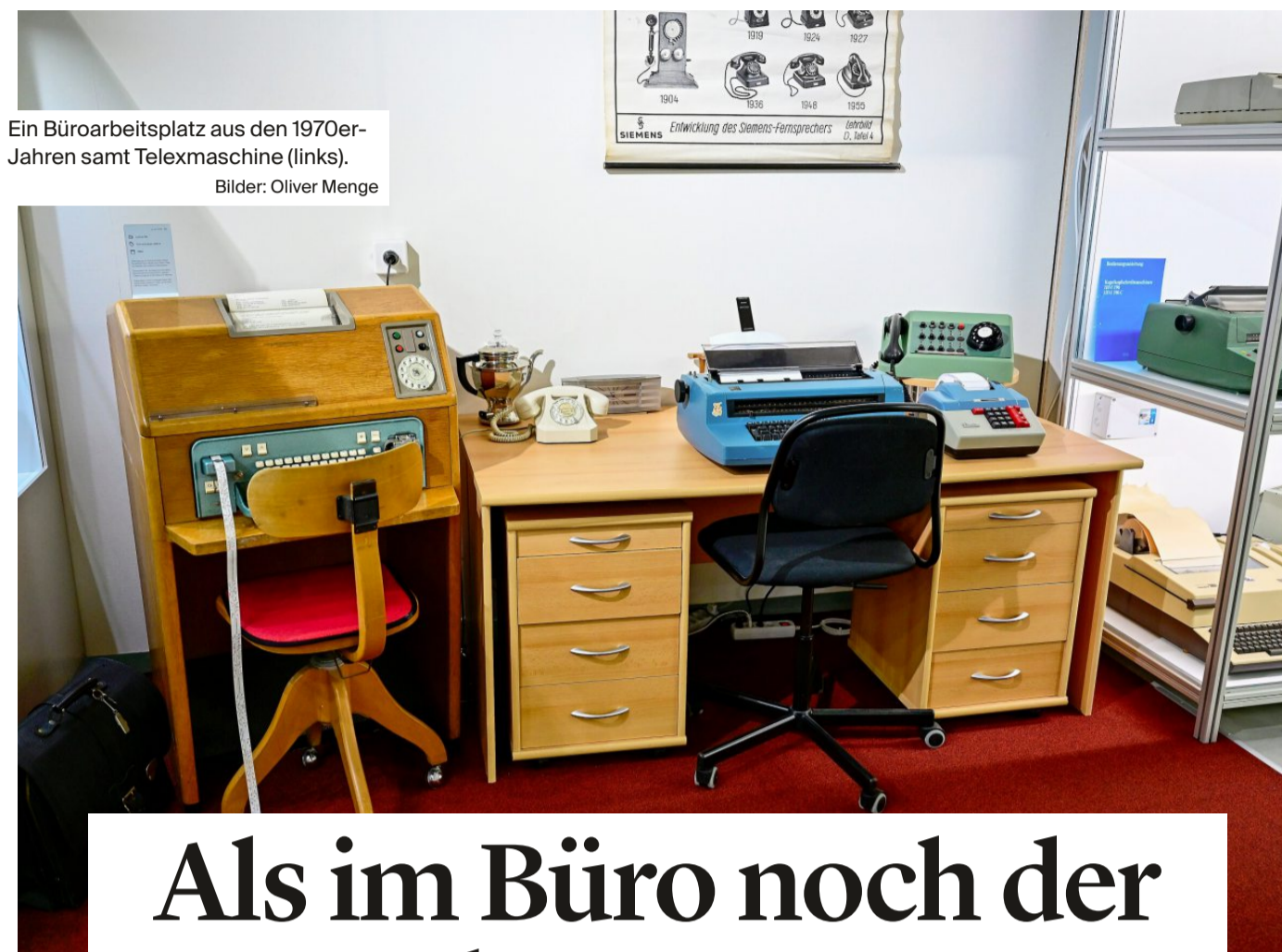
Ein Büroarbeitsplatz aus den 1970er-Jahren samt Telexmaschine (links).

Die Ausstellung zeigt die Entwicklung der Büroarbeit anhand einer breiten Palette von Objekten, von denen einige geradezu antiquarisch anmuten, die aber insgesamt eine Ästhetik vermitteln, die man heute in vielen Büros schmerzlich vermisst.