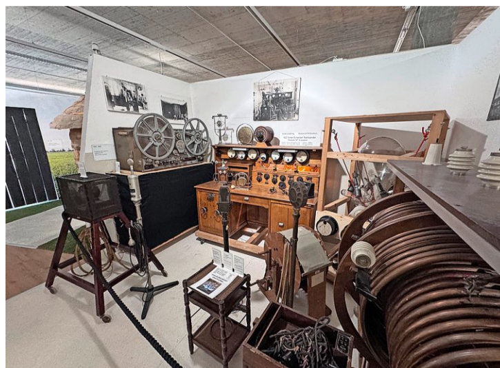
Im originalgetreu nachgebauten ersten Rundfunkstudio der Schweiz steht eine der Lorenz-Stahltonbandmaschinen.

die von der BBC aufgezeichnet wurde. Auch Neville Chamberlains Kriegserklärung Grossbritanniens an Deutschland vom 3. September 1939 ist erhalten. Die meisten anderen Aufnahmen gingen verloren, viele wurden jedoch vor der endgültigen Verrottung auf moderne-